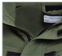
VŠECHNY ZIPY YKK